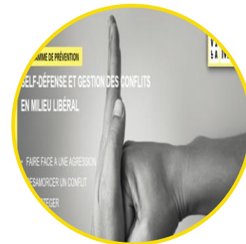
Gestions des conflits