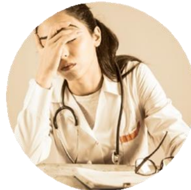
SAS de récupération